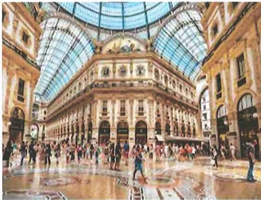
GALLERIA VITTORIO EMANUELE II