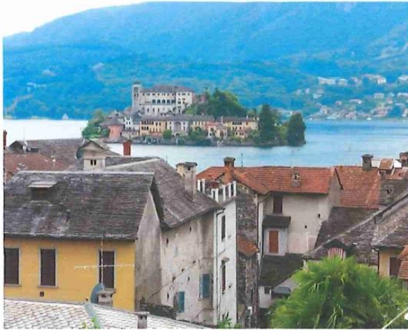
ORTA SAN LAC ET L'ILE ST GIULO