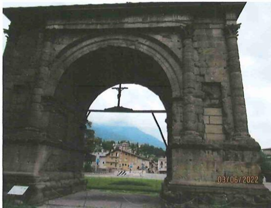
AOSTE L'ARC D'AUGUSTE