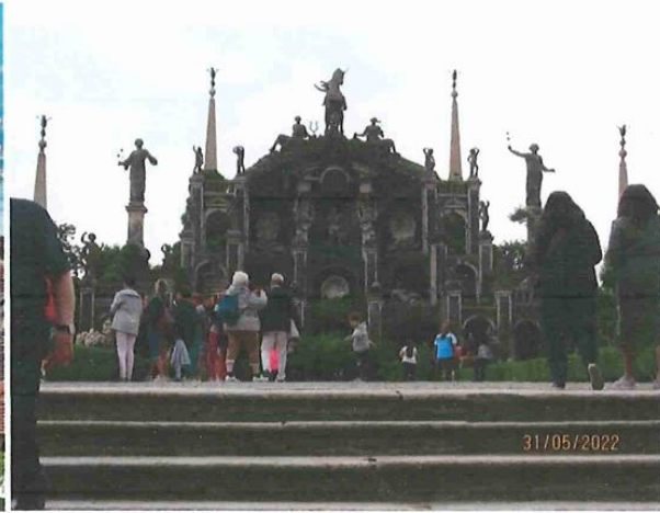
ISOLA BELLA (ILE BORROMEE)