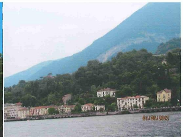
LE LAC DE COME ET SES SOMPTUEUSES VILLAS