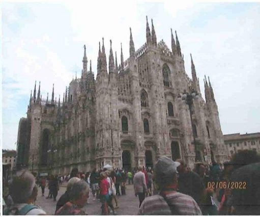
LE DUOMO (cathédrale)