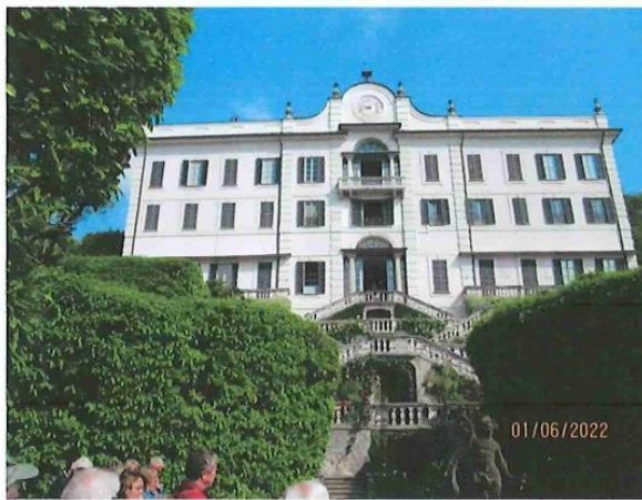
TREMEZZO : LA VILLA CARLOTTA