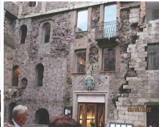
LES VESTIGES témoins d'un lointain passé