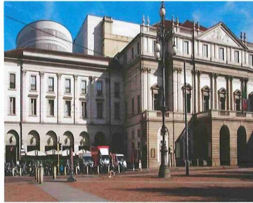
LE THEATRE : LA SCALA